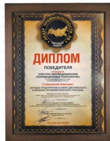
Диплом победителя ежегодного конкурса «Лидер промышленности РФ-2017» в специальной номинации «Лучшее предприятие в сфере диетического и лечебно-профилактического питания»