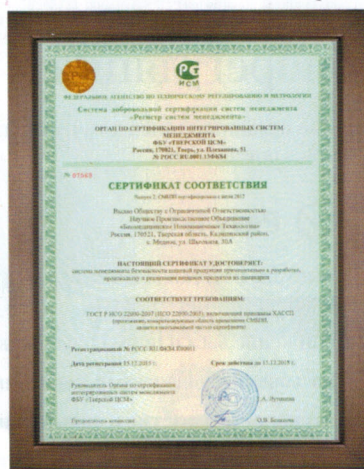
Сертификат соответствия требованиям ГОСТ Р ИСО 22000-2007 (ИСО 22000:2005)

Соответствие требованиям ГОСТ Р ИСО 22000-2007 (ИСО 22000:2005)