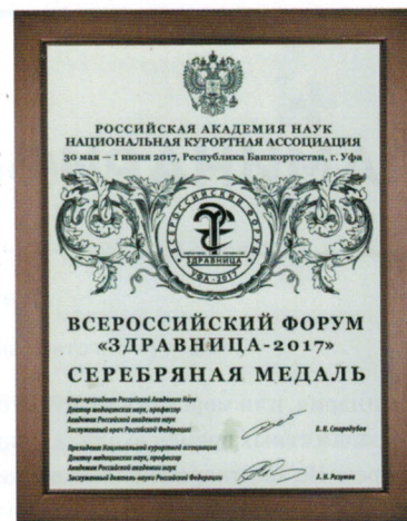
Серебряная медаль на ежегодном всероссийском форуме «Здравница-2017»

Натуральный живой продукт, который хранится исключительно в холодильнике и всего 4 месяца