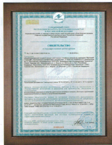
Государственная регистрация Vertera Gel в качестве продукта специализированного диетического лечебного питания